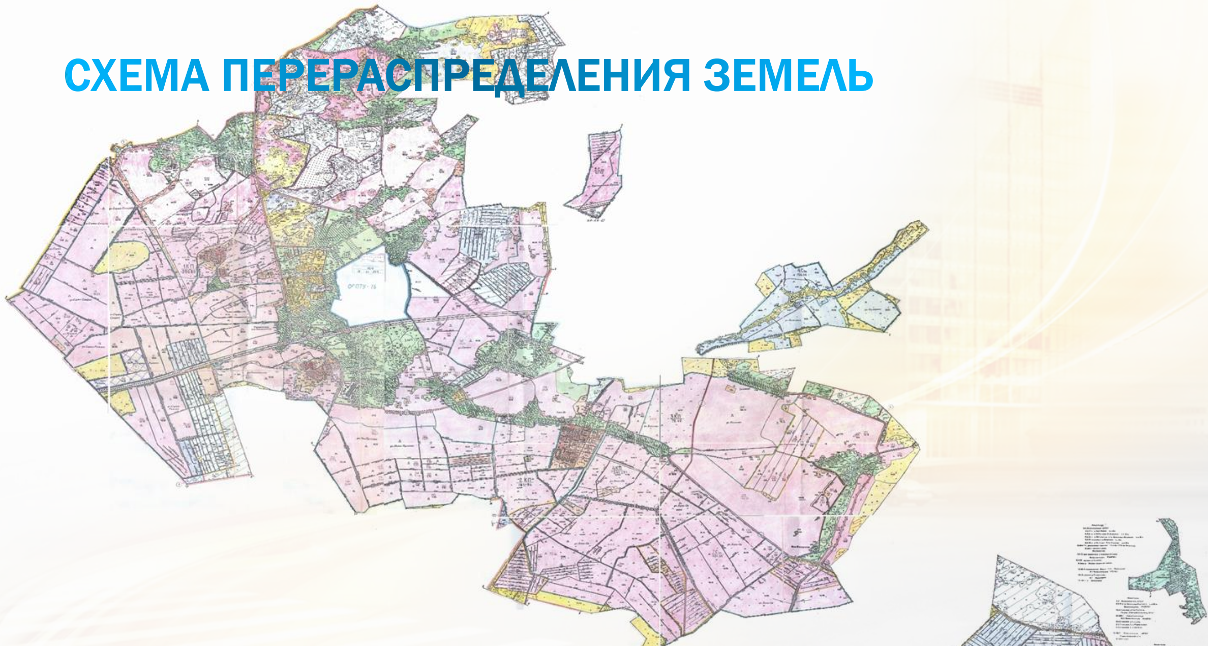
СХЕМА ПЕРЕРАСПРЕДЕЛЕНИЯ ЗЕМЕЛЬ